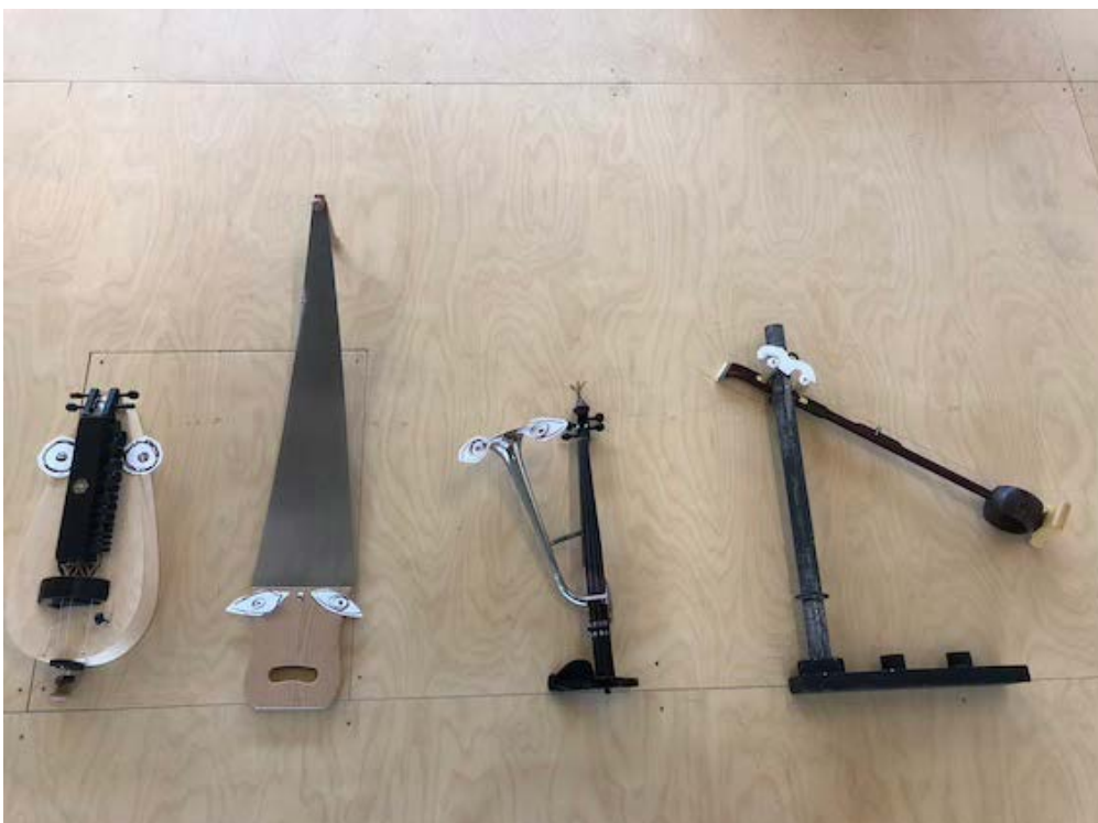
Vieille-à-roue // Scie musicale // Stroh-Violon trompette // Violon chinois