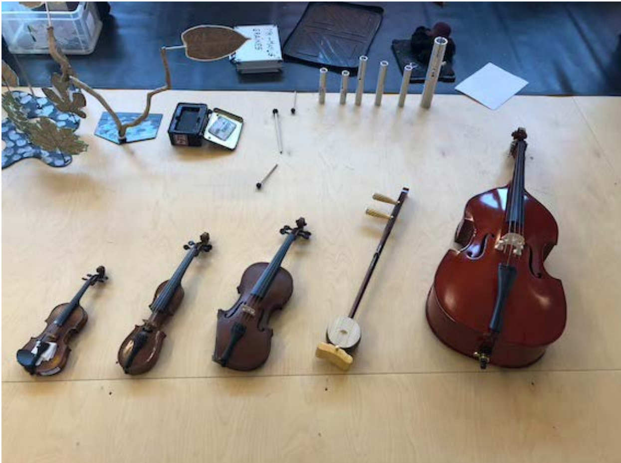
Mini-violon 1/16 ème // Violon la Pochette // Violon siamois // Violon Chinois // Mini-Contrebasse 1/32 ème